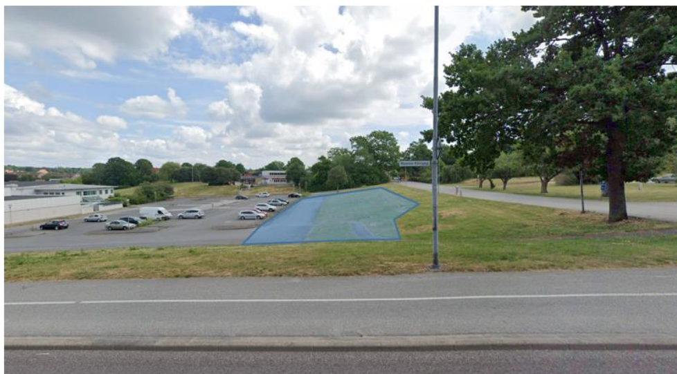
Ungefärlig placering visas med ljusblått i bilden ovan.

Platsen som föreslås är i den södra delen av parkeringen mellan Knut Hahnskolan och Persborgsvägen. Anläggningen är tänkt att placeras i slänten mellan parkeringen och vägen. Ytan som kommer att nyttjas uppgår till ca 900 kvm fördelade på 200 kvm föreningsyta och 700 kvm skatepark. Föreningen står för alla kostnader som skateboardparken innebär och måste ta särskild hänsyn till bland annat Miljötekniks ledningar på platsen.