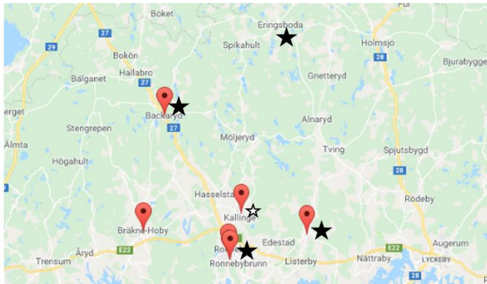
Bild 1 Vård- och omsorgsboenden (röda markeringar), trygghetsboenden/dagcentral (stjärnor)

Det serveras mat till äldre personer på många olika ställen i kommunens regi. Kostenheten står för matsserveringen på vård- och omsorgsboendens samt trygghetsboendet Björkliden i Eringsboda. Äldreförvaltningen står för matsservering på övriga trygghetsboenden samt dagcentral/mötesplats Elsa.