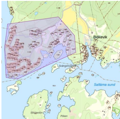
Området i Västra Bökevik.

De fastigheter som inte är registrerade i samfälligheten, vid datum för bildande av verksamhetsområde kommer att anvisas anslutningspunkt och debiteras av kommunfullmäktige beslutad anläggningsavgift.