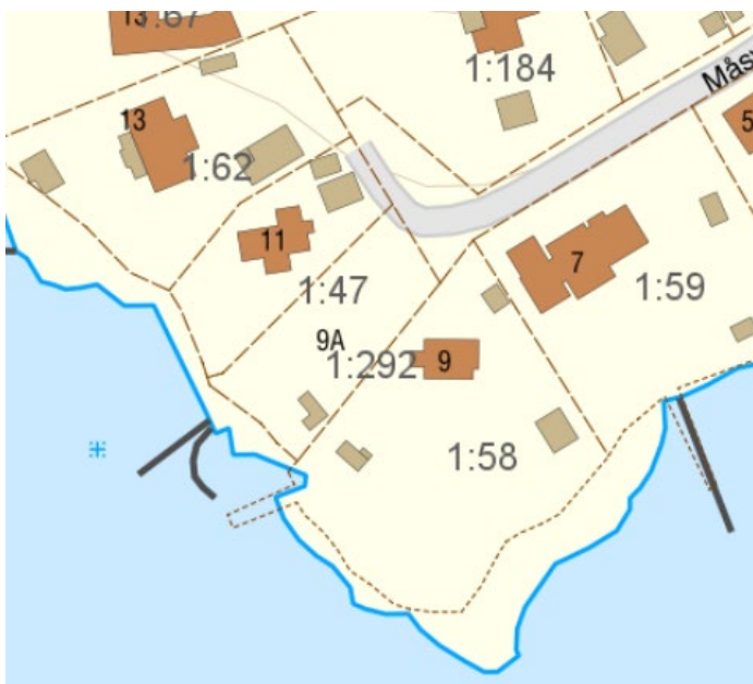
U-område efter ändringen

Fastigheten Droppemåla 1:47 är idag styckad i två fastigheter. Droppemåla 1:47 i nordväst och Droppemåla 1:292 i sydöst. U-området föreslås flyttas till gränsen mot Droppemåla 1:58, där ledningen ligger idag.