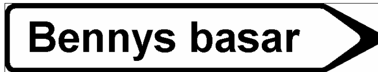
Exempel på skyltning

Bedömningen av dessa ärenden följer till stora delar bedömningen avseende vägvisningen med standardvägmärkena. Även i dessa fall skall trafikantens behov av upplysningen sättas främst. Distansen till vägvisningens start skall också den bedömas utifrån trafikantens behov av upplysningen. Aktuella skyltar får inte äventyra trafikantens förmåga att inhämta trafiknödvändig information.