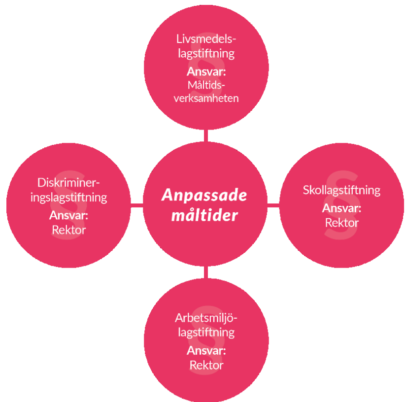
Figur 2: Lagstiftning och ansvar rörande anpassade måltider.