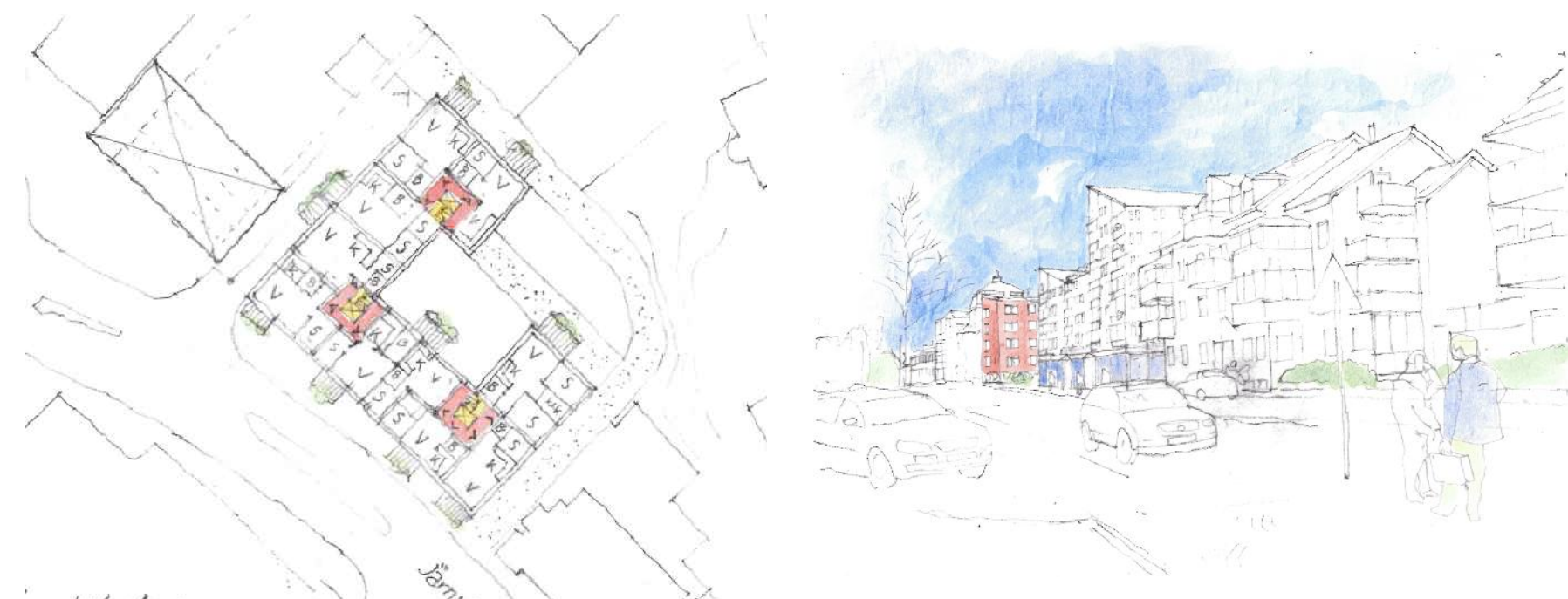
Illustration med typiskt våningsplan för ny bebyggelse på Gertrud 9 och Gertrud 10.