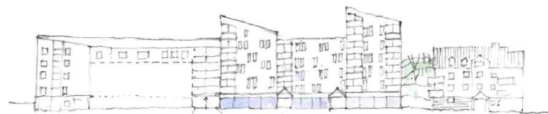
Illustration med fasad och sektion längs Järnvägsgränd.