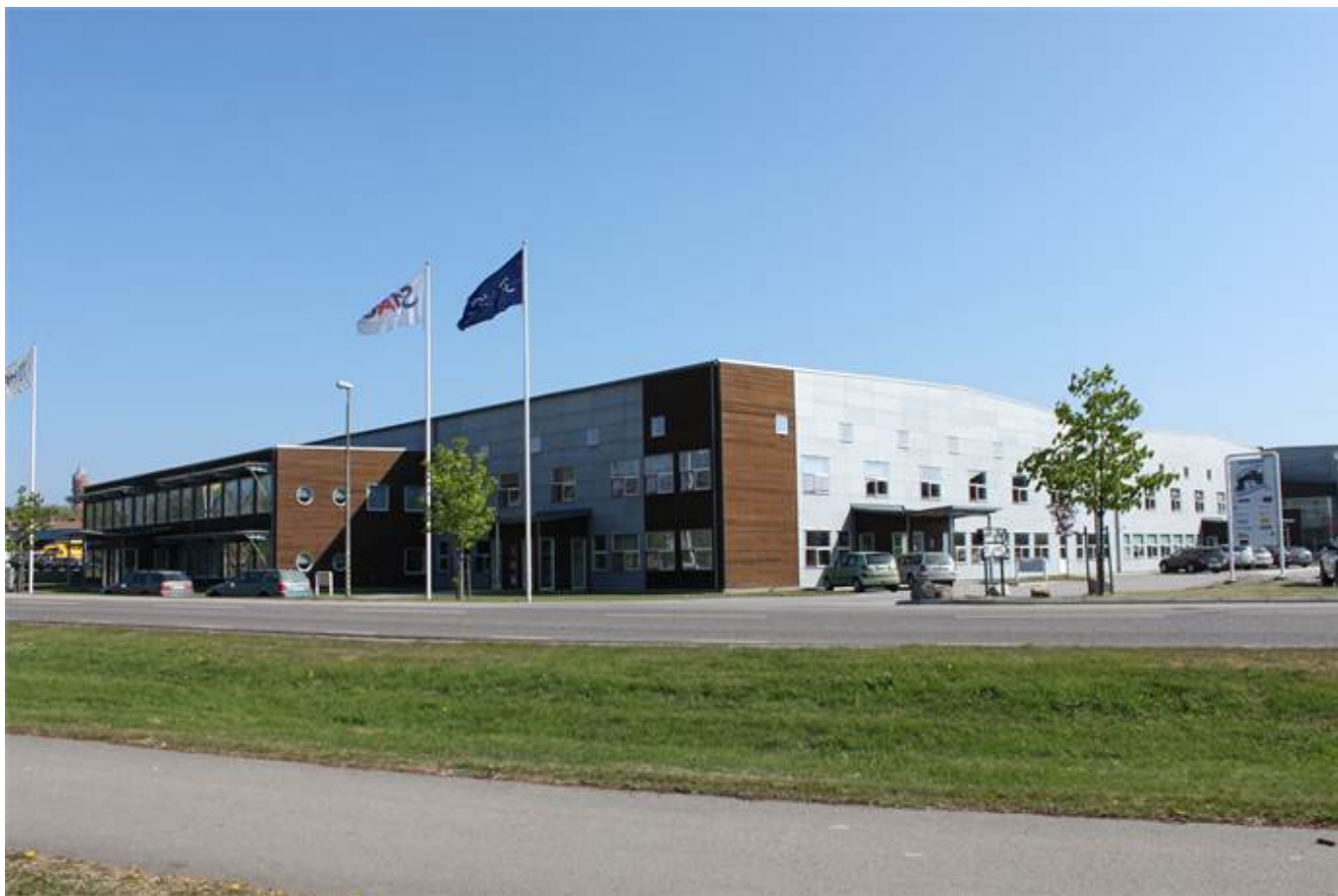
Fridhemsvägen 15, Kvarteret Telefonen, Ronneby - Kontor | Övrigt