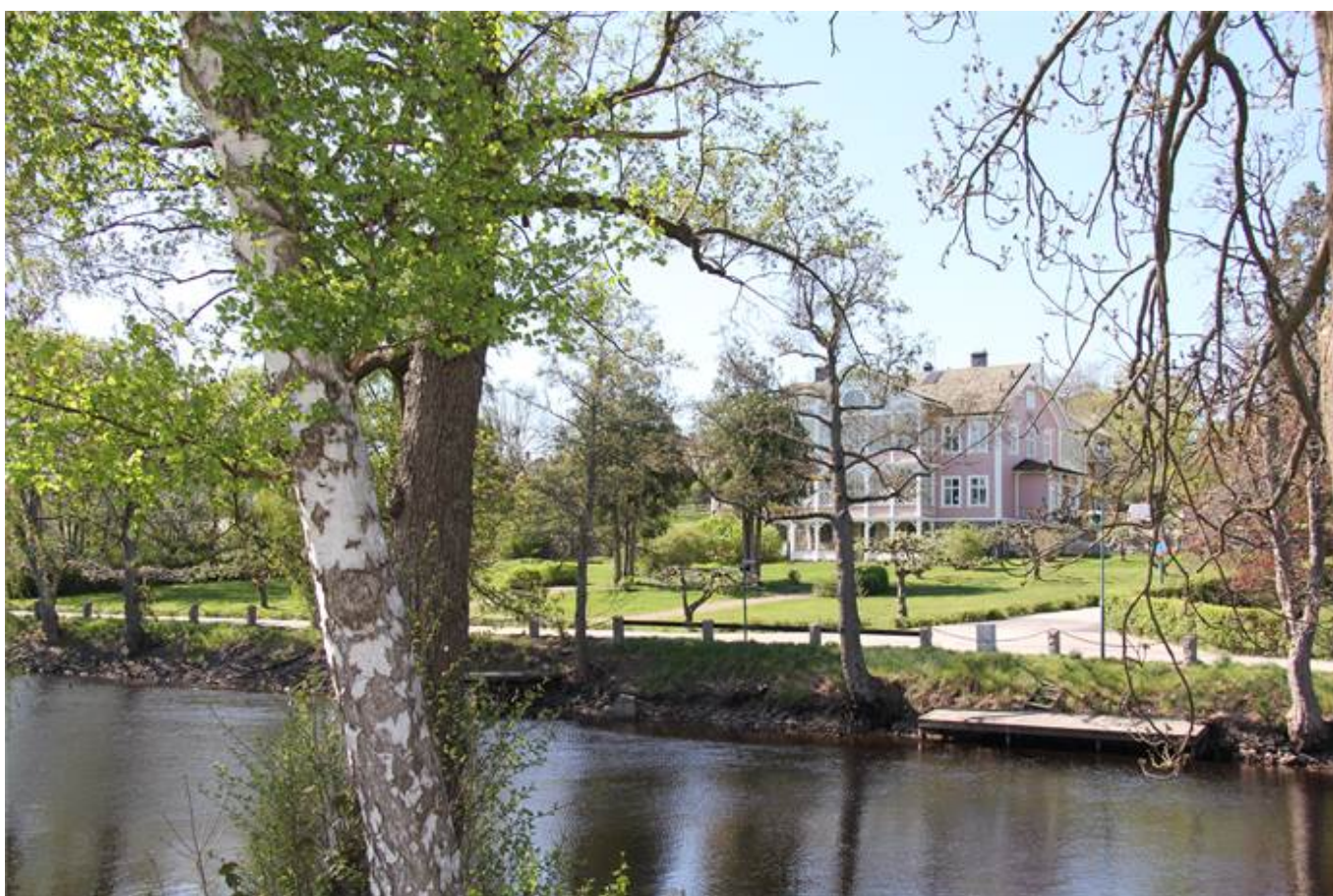
Fridhemsvägen 15, Kvarteret Telefonen, Ronneby - Kontor | Övrigt