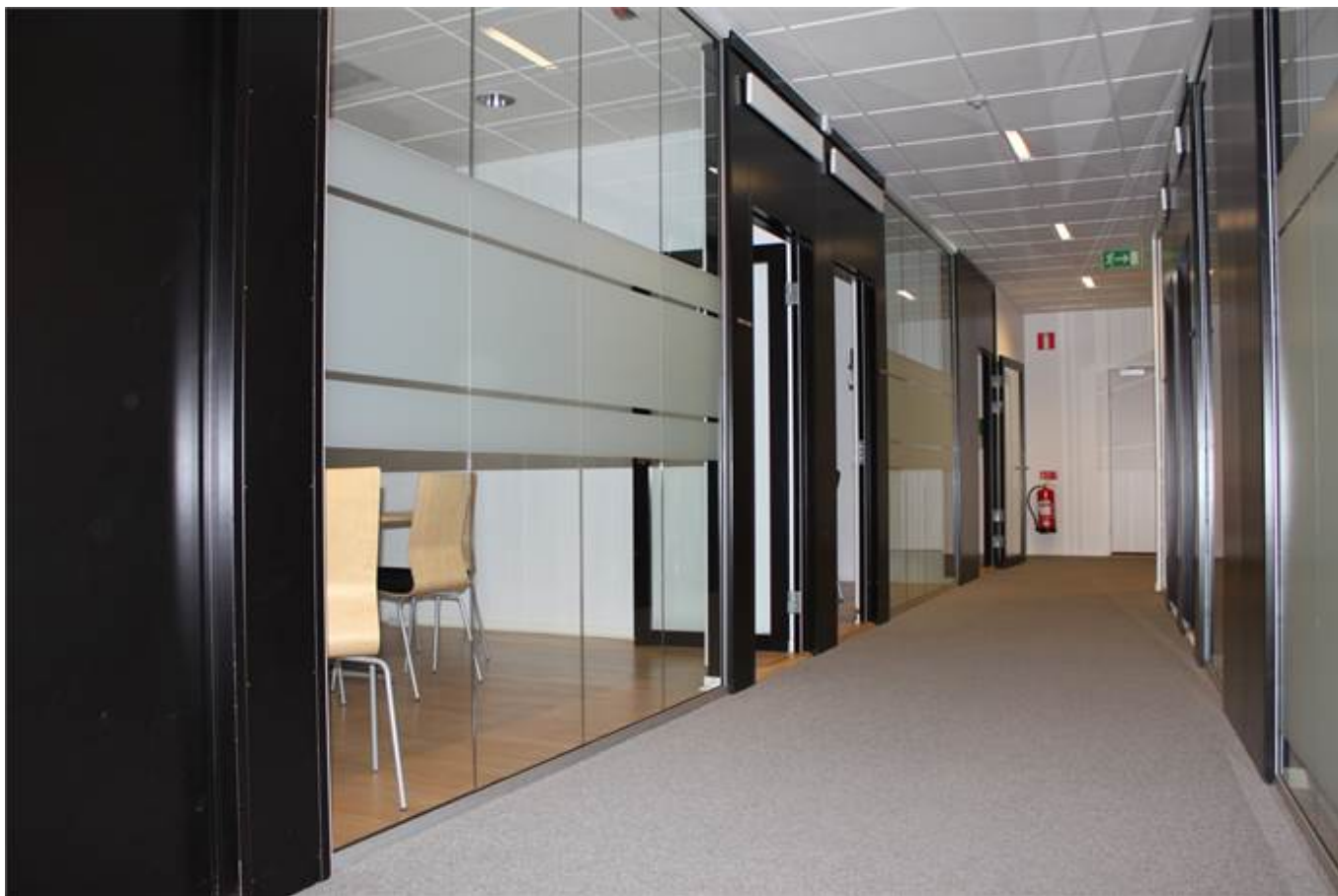
Korridor mot konferensrum