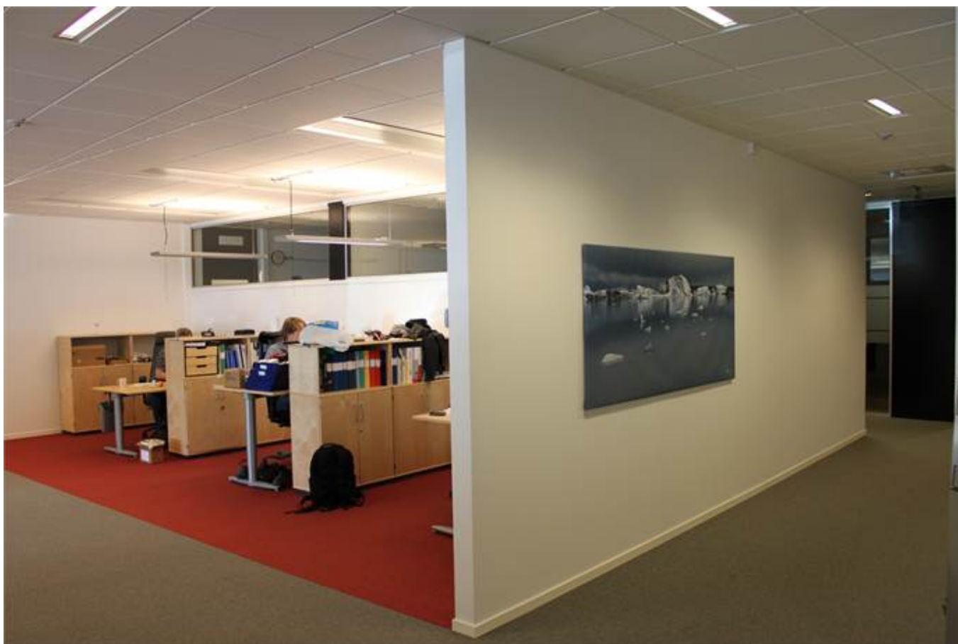
Hall och öppen kontorsyta