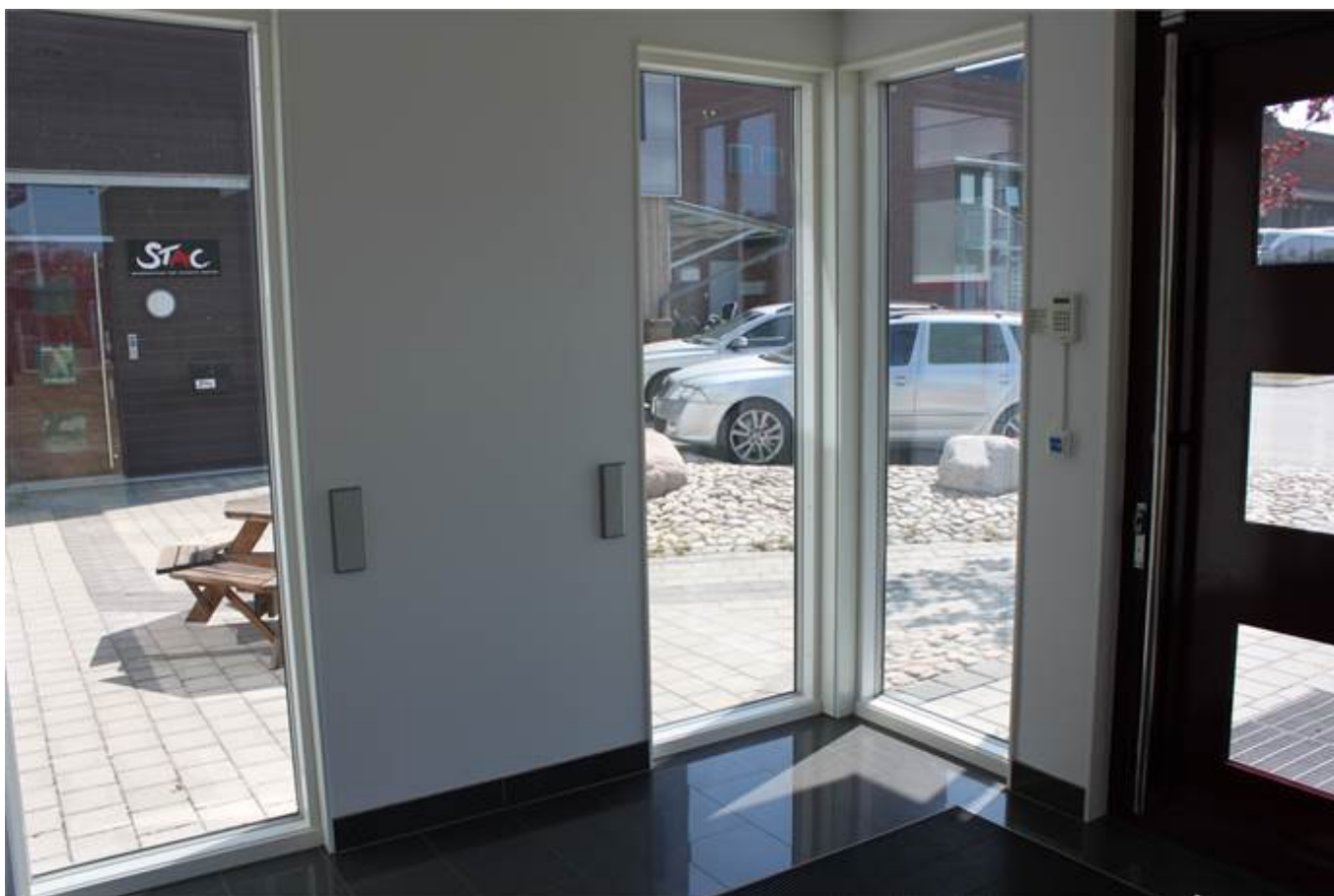
Entré med fikabord utanför