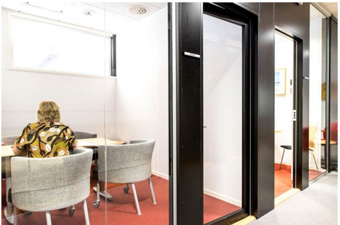
Glasväggar avskärmar och släpper in ljus