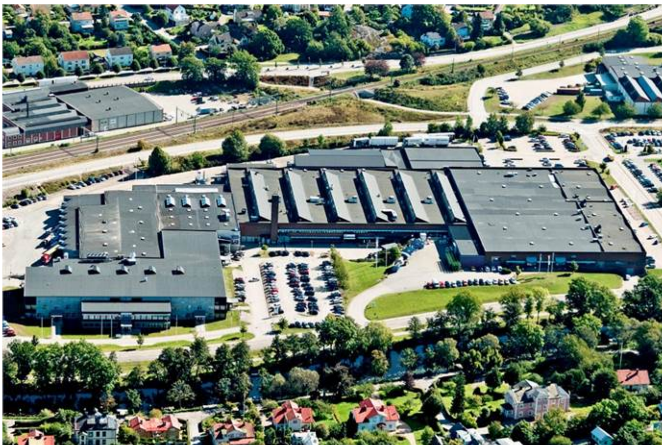
Fridhemsvägen 15, Kvarteret Telefonen, Ronneby - Kontor | Övrigt