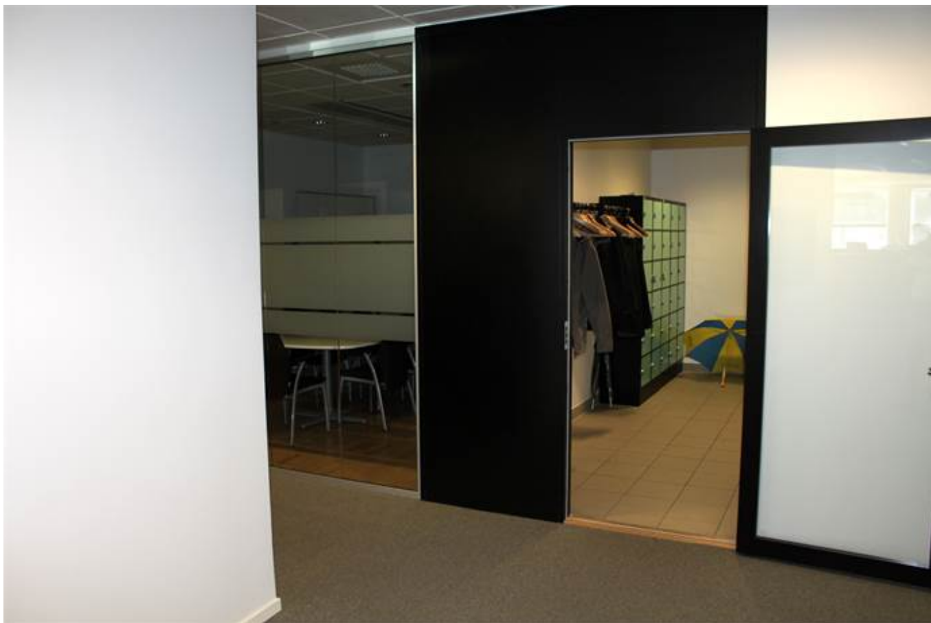
Korridor mot personalutrymmen