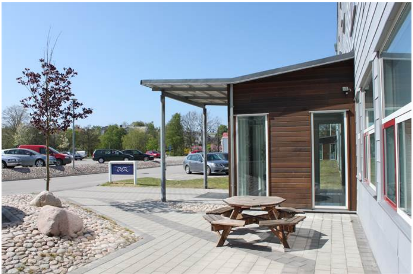
Fikahörn i solen