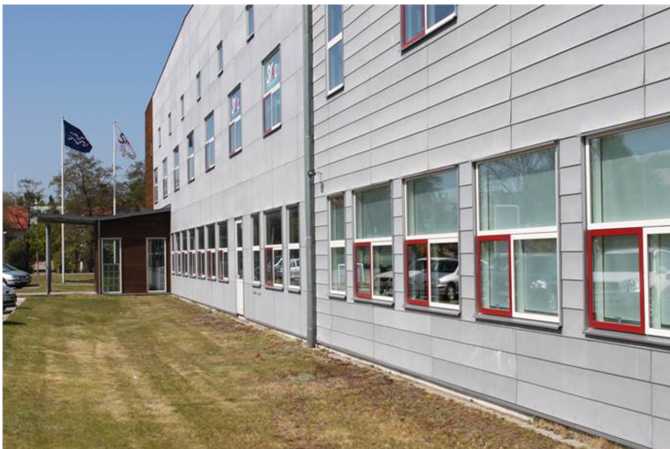
Fridhemsvägen 15, Kvarteret Telefonen, Ronneby - Kontor | Övrigt