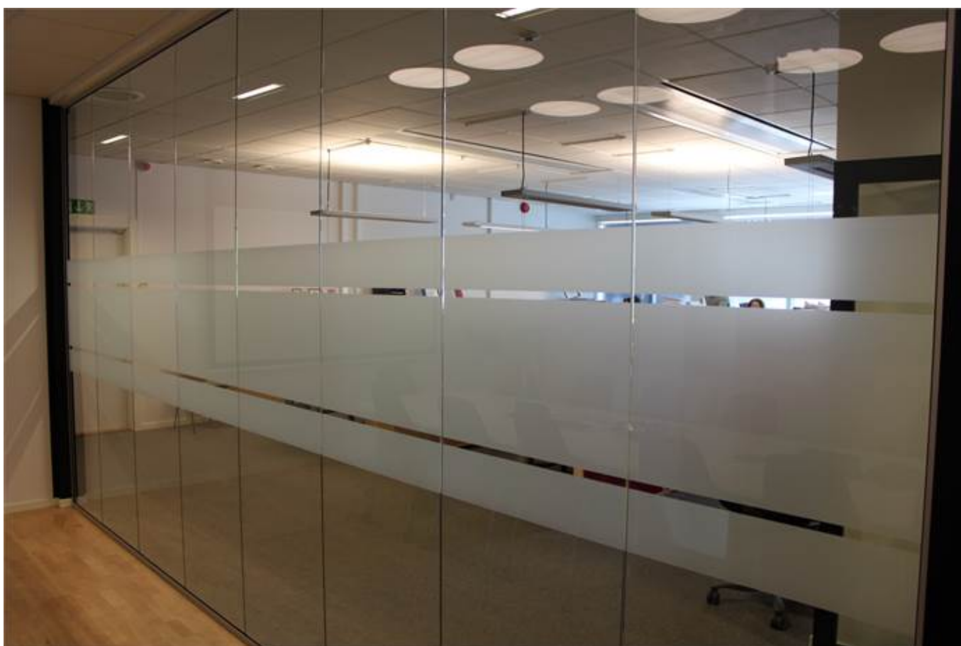
Glasväggar avskärmar och släpper in ljus