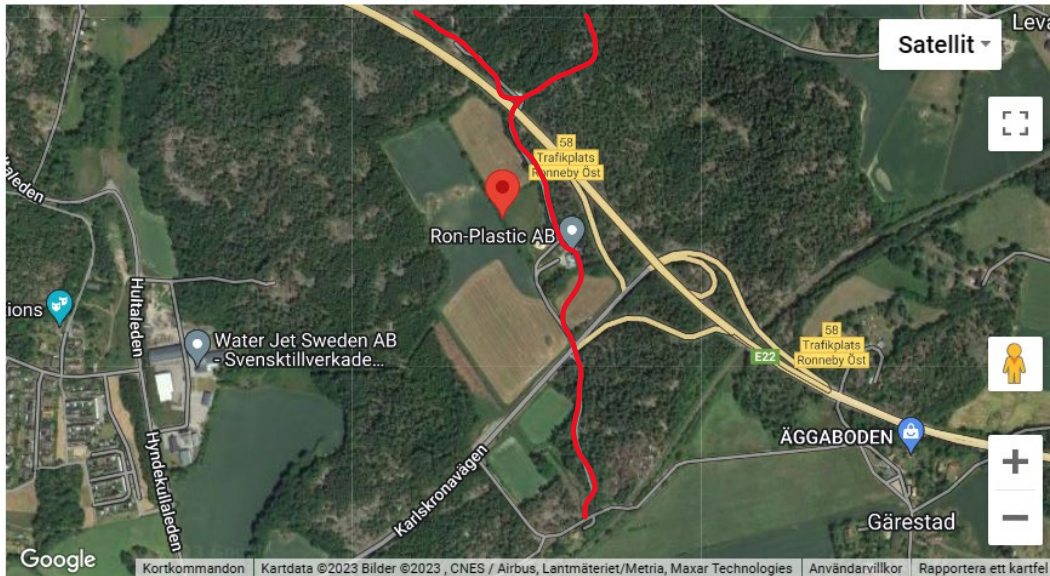
Figur 2, satellitbild över aktuellt område, rödmarkerad stig beskriver rekreativsvägen enligt texten nedan.