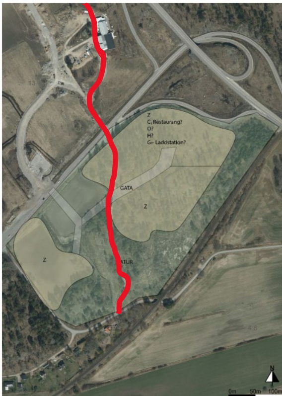
Figur 1, sydöstra gårdet med stig markerad i rött

Önskemålet är att hänsyn tas till dessa rekreationsmöjligheter och att planeringen på något sätt bevarar möjligheten att ta sig från Gärestads Bygata – (på den nuvarande grusvägen) vidare genom sydöstra Gärdet, över Karlskronavägen och vidare förbi Gärdet 1:13 under E 22 och norrut, och detta kan ske på ett någorlunda säkert sätt utan att nyttja Karlskrona-/Logistikvägen.