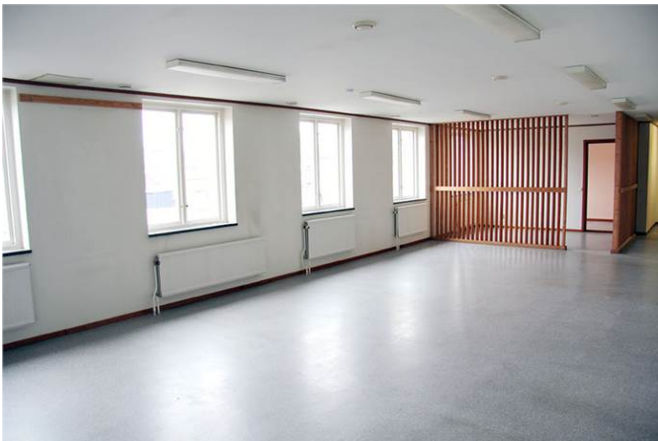
Järnbruksvägen 5, Kallinge Företagscenter, Kallinge - Kontor