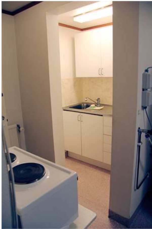
Järnbruksvägen 5, Kallinge Företagscenter, Kallinge - Kontor