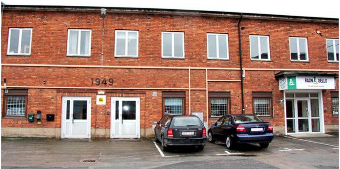
Järnbruksvägen 5, Kallinge Företagscenter, Kallinge - Kontor