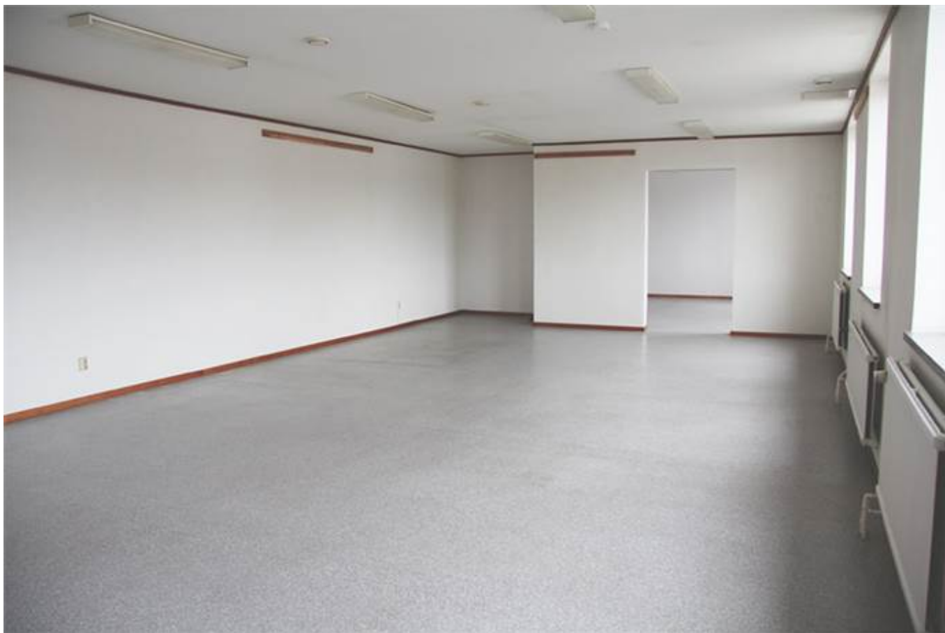
Järnbruksvägen 5, Kallinge Företagscenter, Kallinge - Kontor