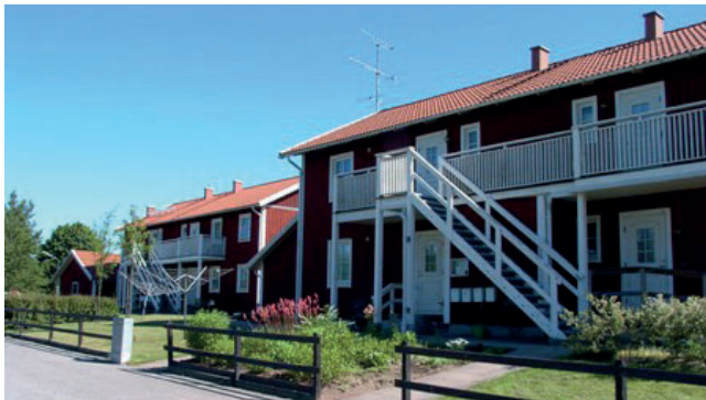
Bostäder i Hallabro.

Genom att planlägga för nya bostäder kan vi göra det möjligt att bygga nya bostäder i kommunen. Detta kan i sin tur ger rörelse på bostadsmarknaden. Genom att kommunen äger mark kan bostadsutvecklingen styras för att få till stånd nya bostäder i kommunen.