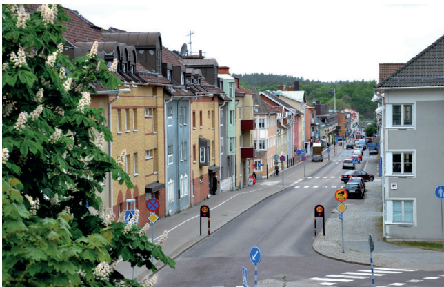
Bostäder i Ronneby centrum.

Fram till för några år sedan minskade befolkningen i kommunen och många bostäder stod tomma. De stora flyktingströmmarna till Sverige och Ronnebys höga mottagande under 2015 och 2016, har inneburit att vi idag har en ökande befolkning. I Ronneby kommun bor idag ca 29 300 invånare (juni 2017). Framförallt är det de yngsta och äldsta åldersgrupperna som ökar. Fram till 2020 förväntas befolkningen öka till ca 30 500 personer.